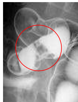
大腸がん (円で囲んだ部分)